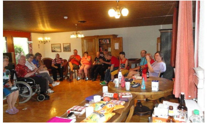
Rangverkündigung und Abschlussrunde

Am Samstagmorgen wurden die ersten Gäste schon bald nach dem Frühstück abgeholt. Herzlichen Dank an alle Gäste und Ferienbegleiter. Es war eine sehr schöne Woche mit viel Wetterglück, fairen Jassern und guten Begegnungen.