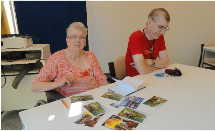
Die Zuschauer beim Jassturnier nutzten die Zeit zum Kartens schreiben