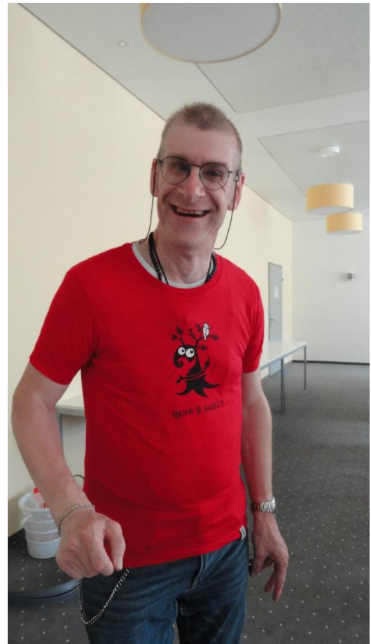
Der Lottopreis passt gut